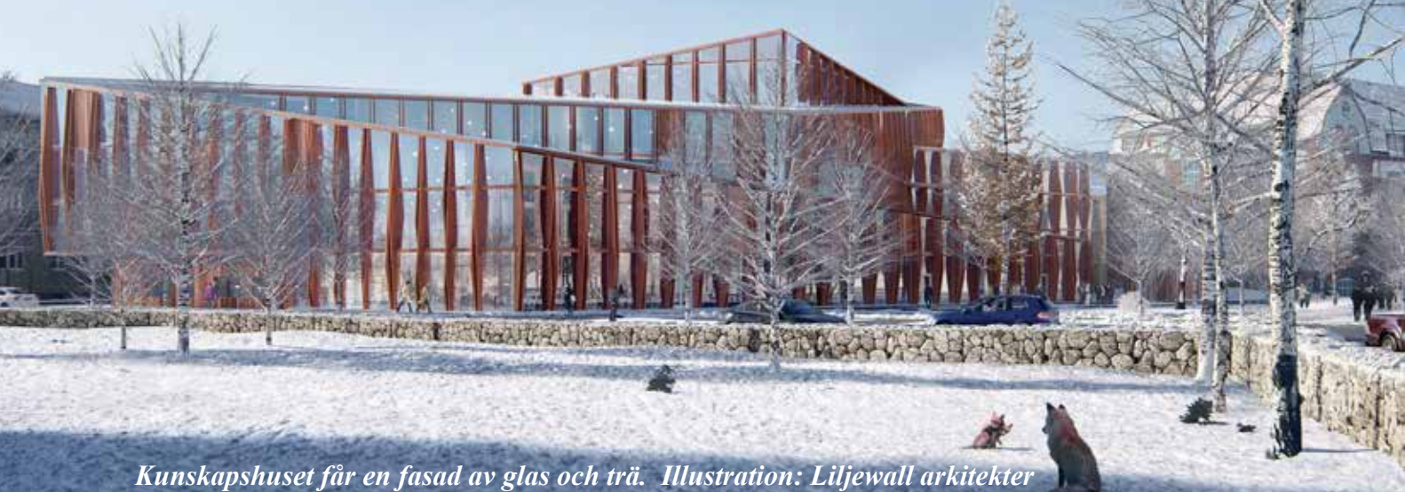
Kunskapshuset får en fasad av glas och trä. Illustration: Liljewall arkitekter

Arbetet med planering för en ny skola i Gällivare centrum går framåt. Byggnaden, som fått namnet Kunskapshuset, ska inrymma kommunens gymnasieskola och lärcentra för vuxna. Beräknad inflyttning är höstterminen 2019 om allt går som planerat.