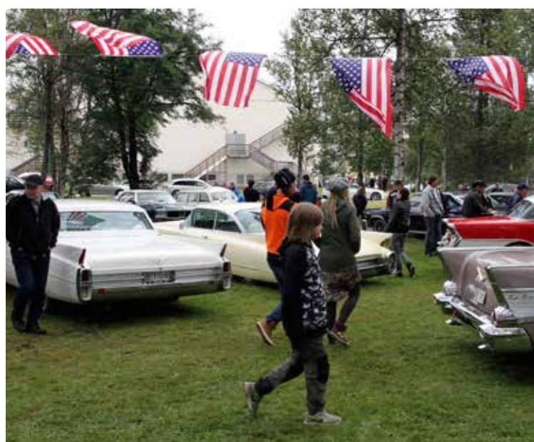
I Svanparken anordnades en välbesökt bilutställning av Mining Town Cruisers.