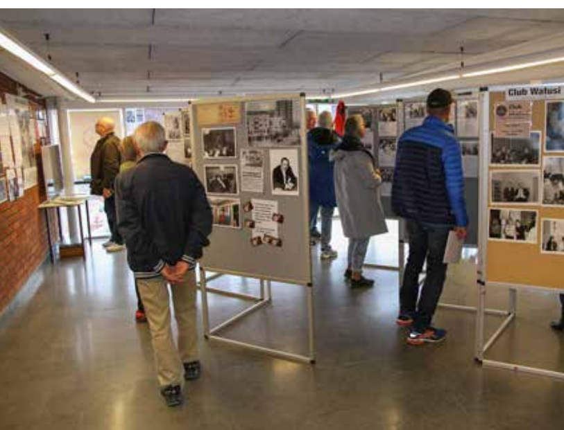
Sporthallen fungerade som ett besökscenter med fotoutställningar, café och informationskontor.