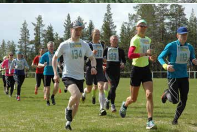
Starten går för Lapplands Långlopp