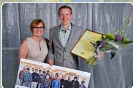
Årets kommunala verksamhet SAVO