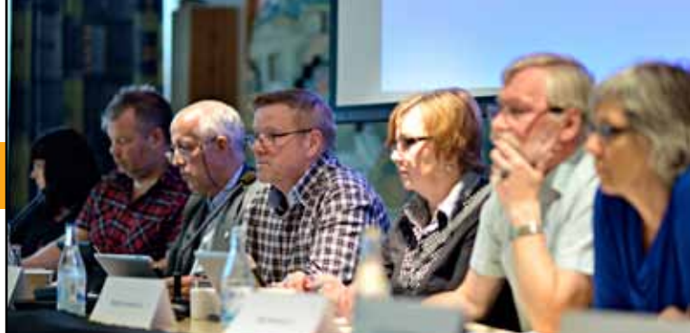
Den 12-13 juni bjöd kommunstyrelsen in boende i östra Malmberget till dialogmöten.

Att ha möjligheten att överklaga är en demokratisk rättighet som vi ska slå vakt om. Och har kommunen exempelvis gjort något fel så ska vi göra om, och göra rätt. Men där finns också ett moment av ansvar hos den som överklagar. Att ta kontakt, samla fakta från alla parter och få andra infallsvinklar, är alltid av godo innan man skriker till verket. En bra och vägvinnande start för alla parter som sällan sker, tyvärr.