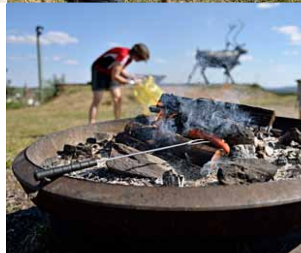
Belöningen, korvgrillning efter utfört arbete.

När vi summerar Städskampanjen kan vi konstatera att vi blev lite fler städare i år än förra året. Vi vet dock att det är många som städar men som inte går in och anmäler sig, tyvärr.