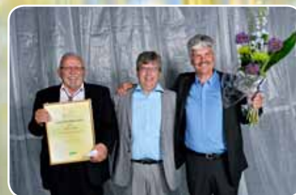
Coop Malmfälten-priset MS Meet