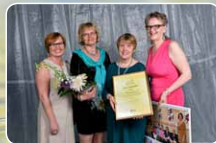
Årets kommunala verksamhet Vassarahem 2