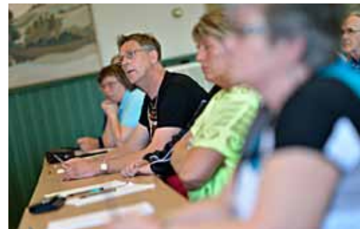
Många viktiga frågor ventilerades under dialogmötena.