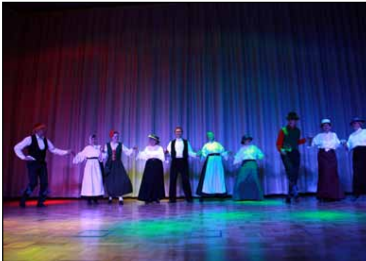
De två översta bilderna är från Dansens Dag 2008 med Gellmalaget.