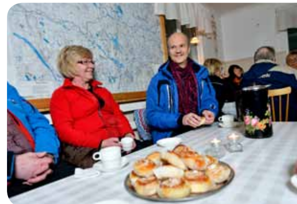
Inomhus passade många på att fika och umgås runt borden i hembygdsgården.