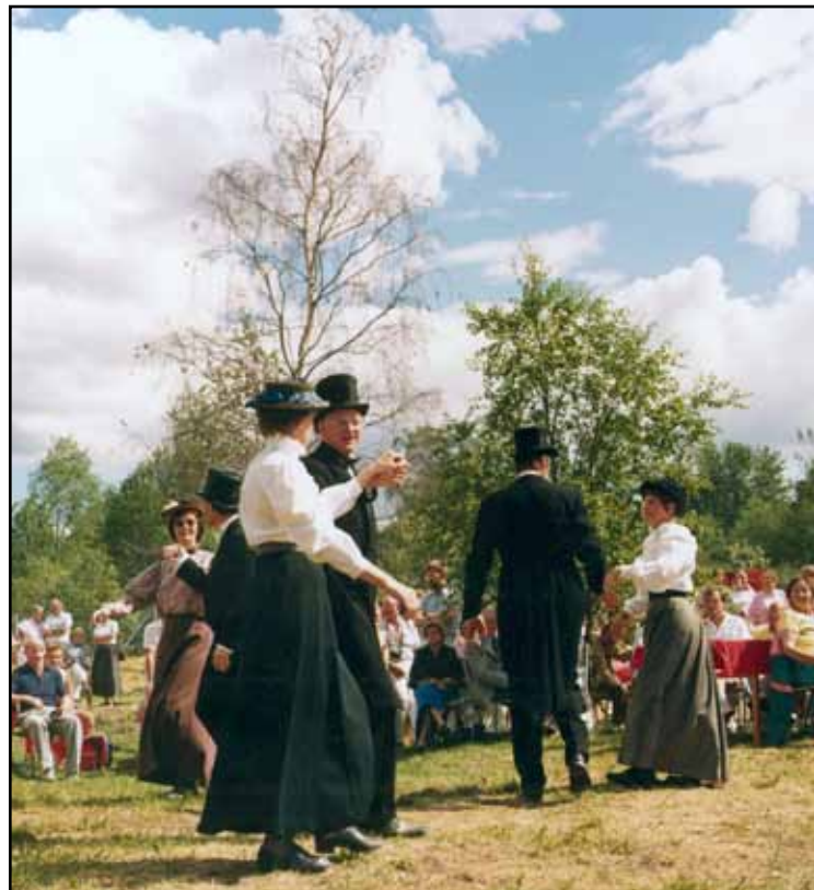
Dans i det gröna vid invigningen av Kåkstan.