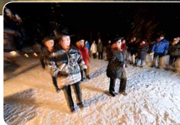
Besökarna möttes av linedance i islyktornas sken.