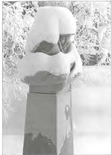
Statyn Same är underbar att se i vinterskrud. Åke Johansson har tagit en serie bilder som jag tagit som vana att publicera under spalten "I Gällivare trakter"