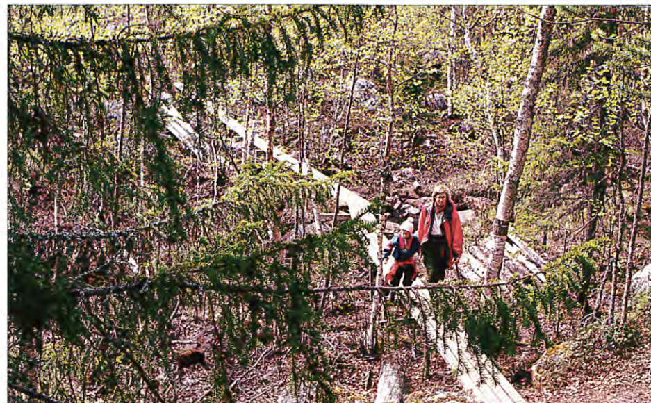
Laponia-Lapplands världsarv består av bl a Muddus nationalpark. En utredning skall studera om var ett Laponia Visitors Center skall placeras i tätorten.