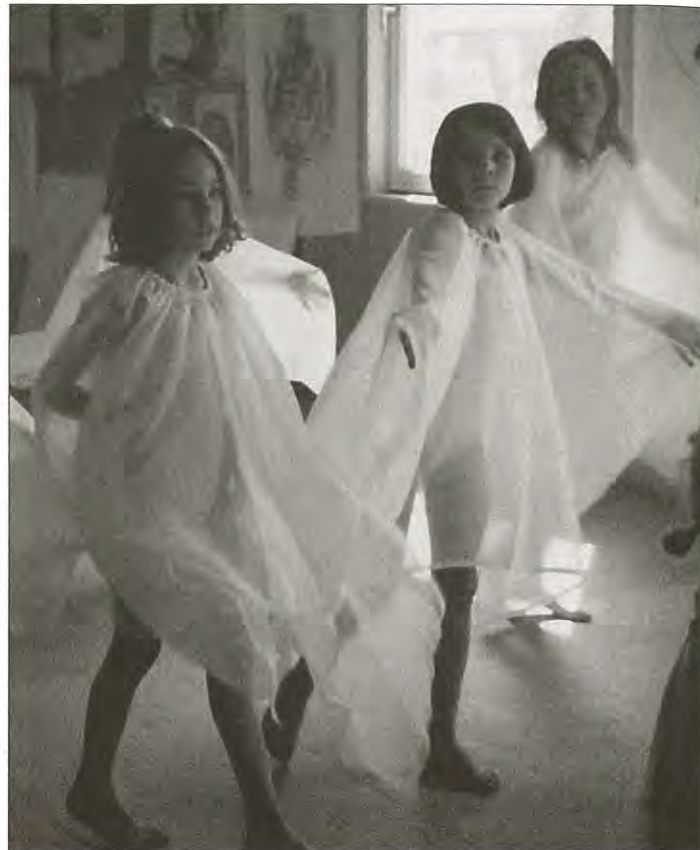
Barnen i de små byarna runt Sarvisvaara dansade barnbaletten "Sommardans".