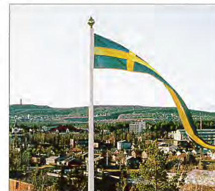
Gällivare behöver världen.

sina respektive områden bör även IT:s Gellivare AB och Friska Gällivare Ekonomisk Förening delta i det internationella arbetet.