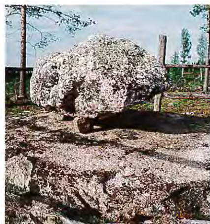
Sittande höna är ett klassiskt begrepp. Var finns i vår kommun den sittande hönan och vad ger den för budskap?