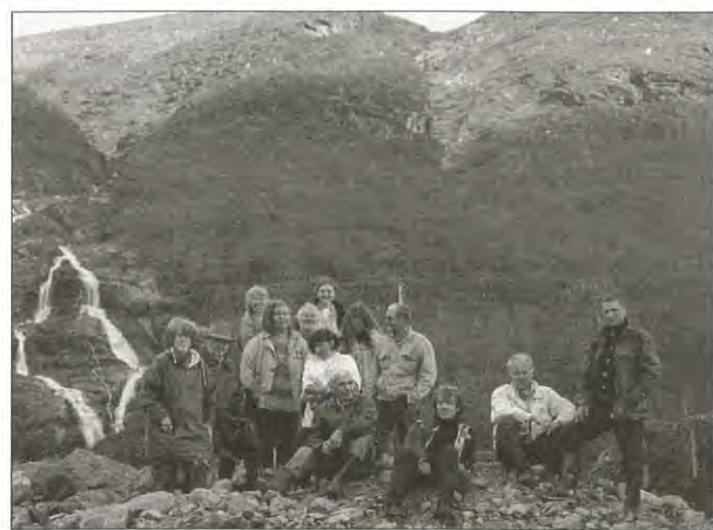
Laplands konstnärskoloni på besök och arbetsresa uppe i Stora Sjöfallet.