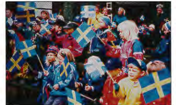
Ung som gammal är välkommen att fira nationaldagen.

Lördag den 6 juni firar vi Sveriges nationaldag med att kl 12.00 starta en parad från Vassaratorget. Alla är välkomna att delta i firandet av nationaldagen. Paraden går genom Gällivare centrum och avslutas med nationalsången och tal vid scenen.