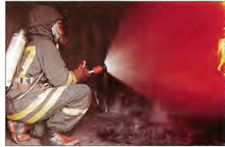
Gällivare räddningstjänst brandmän är vältränade. De har en världsmästare och är lagvä i världen i "Toughest Firefighter Alive".