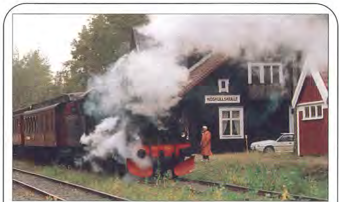
Ett ånglok åker mellan Gällivare och Koskullskulle den 13-14 juni.

Koskullskulle är ett gruvsamhälle. LKAB har därför gruvturer till 850 m nivån. Det är ju tack vare järnmalm som Koskullskulle blev ett samhälle. Utställning om mineral kommer att också att finnas i Koskullskulle.