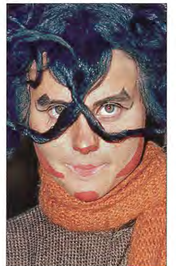
Plupp har bestämt att fira 100-åringen med att vara i Koskullskulle under tiden 14-19 juni.

Det blev så frestande för Plupp att fira 100-åringen så Plupp bestämde att komma till barnens land. Plupp stannar hela veckan och åker sen tillbaka till hembygdsområdet i Gällivare.