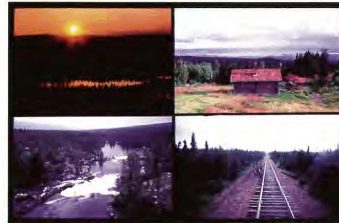
Inlandsbanan bjuder på 1067 km genom Sveriges vackraste natur.

Fel. Ett diesellok på Inlandsbanan kan dra lika mycket gods som 25 lastbilar och ger betydligt mindre utsläpp per fraktat ton. Dessutom driver IBAB ett aktivt arbete för att kartlägga och åtgärda alla miljöproblem. På persontrafiksidan ska försök med etanoldrift inledas, och ett utvecklingsarbete pågår där i samarbete med andra Volvo. I ett senare steg ska nya motorer och bränslen tas fram även på godssidan.