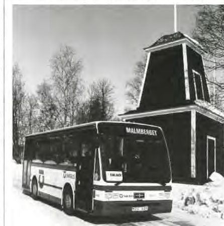
Ringlinjen åker förbi de vackra husen i Hermelin och Kilen.

Bussen åker från busstationen måndag, onsdag och fredag kl 10.00, 12.00 och 14.00. Några minuter senare kan bussresenärerna från Östra Malmberget stiga på och åka till Malmbergets centrum.