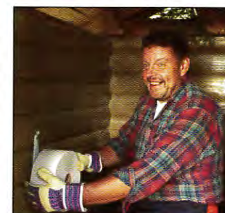
Välskötta toaletter är viktiga för att turisterna skall trivas på rastplatserna