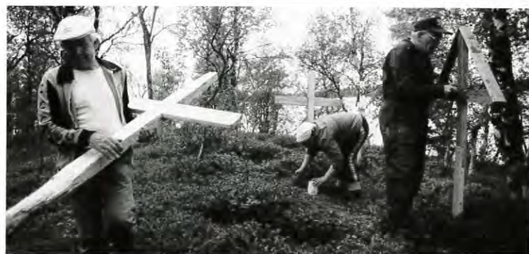
Människorna i Vettasjärvi vårdar sommar-graven som har sett livet komma och gå sin väg.

I mars blir de klar med en annorlunda prispall som kommer att finnas vid stora scenen på Vassaratorget. Junior VM:s alla prisutdelningar kommer nämligen att ske på Vassaratorget.