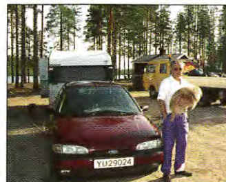
En norsk turist berömmar Gällivare kommun för den fina skötsel av rastplatsen.

Nästa stopp blir vid Leipojärvisjöns rastplats. Två bilar står parkerade och nyfiket börjar jag fråga bilisterna om varför de har stannat på denna rastplats. En pigg norrman berättar att han är på väg till Piteå och sen börjar han berömma de svenska rastplatserna. Rent och snyggt och så ligger denna rastplats så vackert vid sjön.