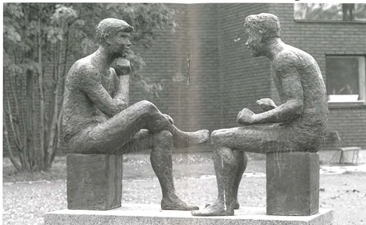
Nu startar diskussion om framtidens tätort. Statyn vid simhallen i Malmberget får symbolisera att "snacket" måste komma igång.

Gällivares kommunala ekonomi är kärv liksom alla andra svenska kommuner. Vi ligger i tio i topp listan över de kommuner som har den högsta kommunalskatten. Avgifter finansierar ca 10%. Slutsatsen blir att besparingarna kommer att fortsätta och att Gällivare måste lita på sin egen förmåga.