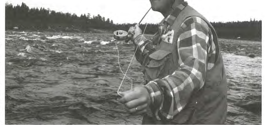
Fjällfiske är en viktig fritidssysselsättning för kommuninvånarna.

De tre kommunerna efter älv-dalen -Gällivare, Boden, Jokkmokk- har tillsammans med Vattenfall och Kammarkollegiet träffat en överenskommelse om fiskevårdande åtgärder i Lule älvdal. I vår kommun berörs Stora luleälvens sjöar uppströms Porjus