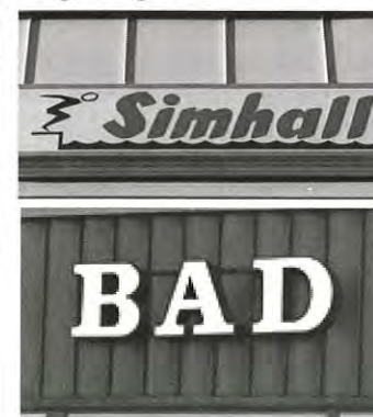
En simhall räcker för en tätort, anser tätortsgruppen.

gruppen, att med gemensamma ansträngningar över parti- och ortsgänser skapa förutsättningar för framtidssatsningar och besparingar.