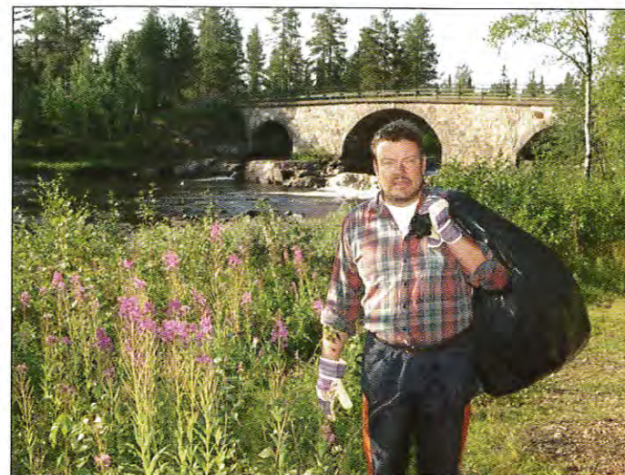
Sopor, Nordström och Stenbron