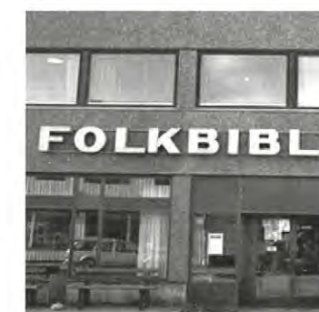
Koncentrera biblioteksverksamheten till Malmberget

Malmberget är redan idag ett utbildnings- och kulturcentrum. Men det gäller att kraftsamla och därför måste det ske en koncentration av kultursatsningarna.