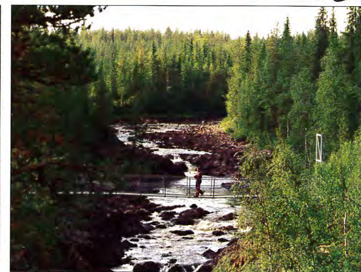
Det vackra Hakkasfallet som bara väntar på besökare.