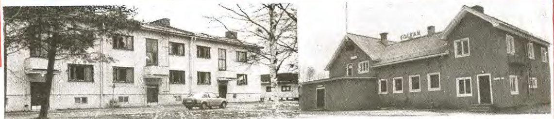
Vilket är viktigast - att rusta upp pensionärsbostäderna (t v) eller Folkets Hus (t h)? Det kan bli en av frågorna som innevanarna i Östra Koskullskulle får fundera över.

... Områdets karaktär med stora tomter skall bibehållas.