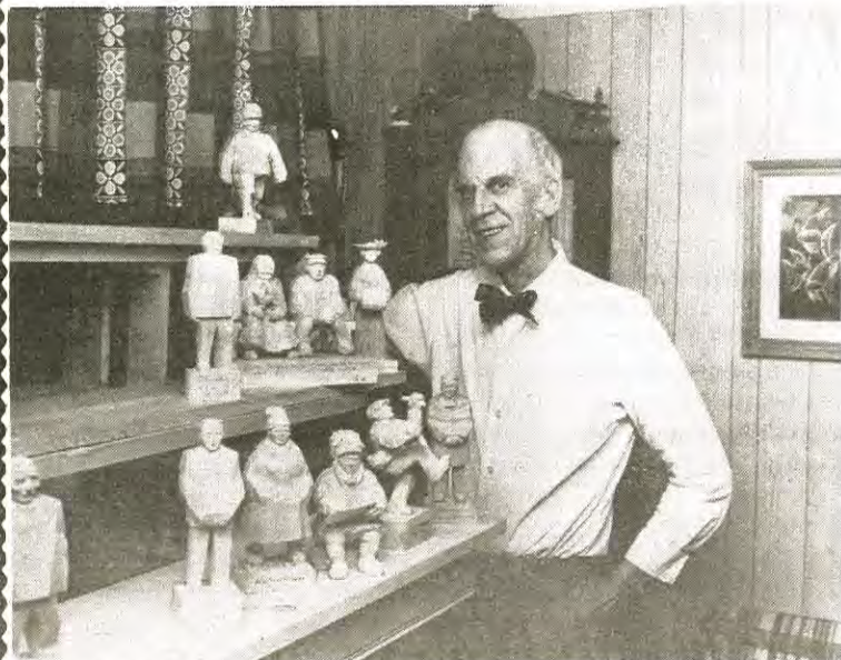
Nu har Åke Sundqvists historiska gubbar och gummor blivit kommunal egendom för 150 000 kr.

Antalet kommunala "gubbar" i Gällivare ökade kraftigt vid fullmäktiges sammanträde i slutet av augusti. Anledningen var ett enhälligt beslut om att kommunen skulle köpa in 72 träskulpturer efter avlidne träsnidaren Åke Sundqvist, Malmberget.