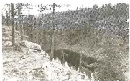
Djävulsklyftan ligger utanför Koskullskulle.