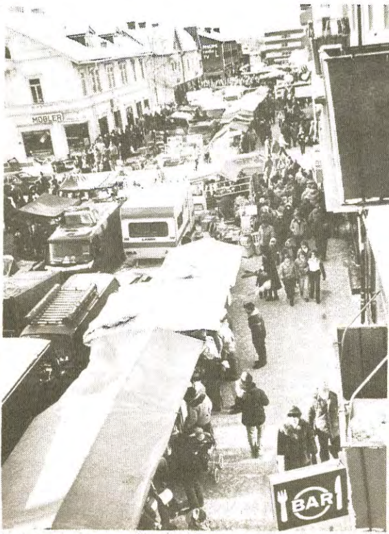
Den 19—21 mars är det dags för Gällivare marknad igen. Då fylls Storgatan med marknadsstånd och människor.

På fredag är det dags igen. Marknadsfolket invaderar Gällivare centrum och börjar spika upp sina stånd längs Storgatan. Men gatuförsäljarna är inte längre ensamma om att locka kunder till sina stånd. I år får kommunens egna hantverkare och småföretagare chansen att visa sina produkter på en särskild utställning inne i församlingsgården. Det är kommunens näringslivsenhet som står bakom nyordningen.