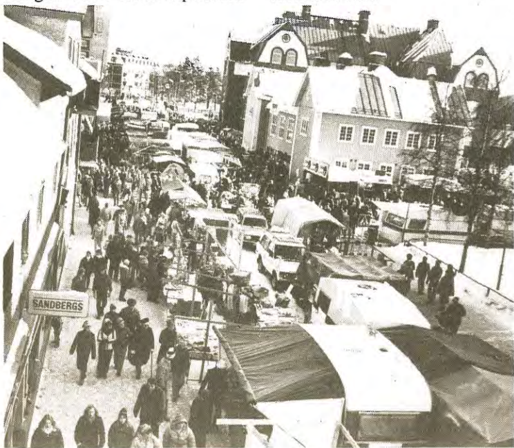
Försäljningen under Gällivare marknad kommer som vanligt att ske ute på gatorna. Bilden från Storgatan.

Trä- och textilslöjd, näverhantverk, kniv- och handsktillverkning samt keramik och skinnarbeten är några exempel på vad som kommer att visas.