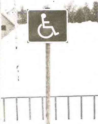
• Här krävs tillstånd!

— Respektera parkeringsplatser som är anvisade för handikappade, uppmanar handikapprådet som anser att vanliga bilister alltför ofta parkerar otillåtet på handikapparkeringsplatserna i Gällivare och Malmberget.