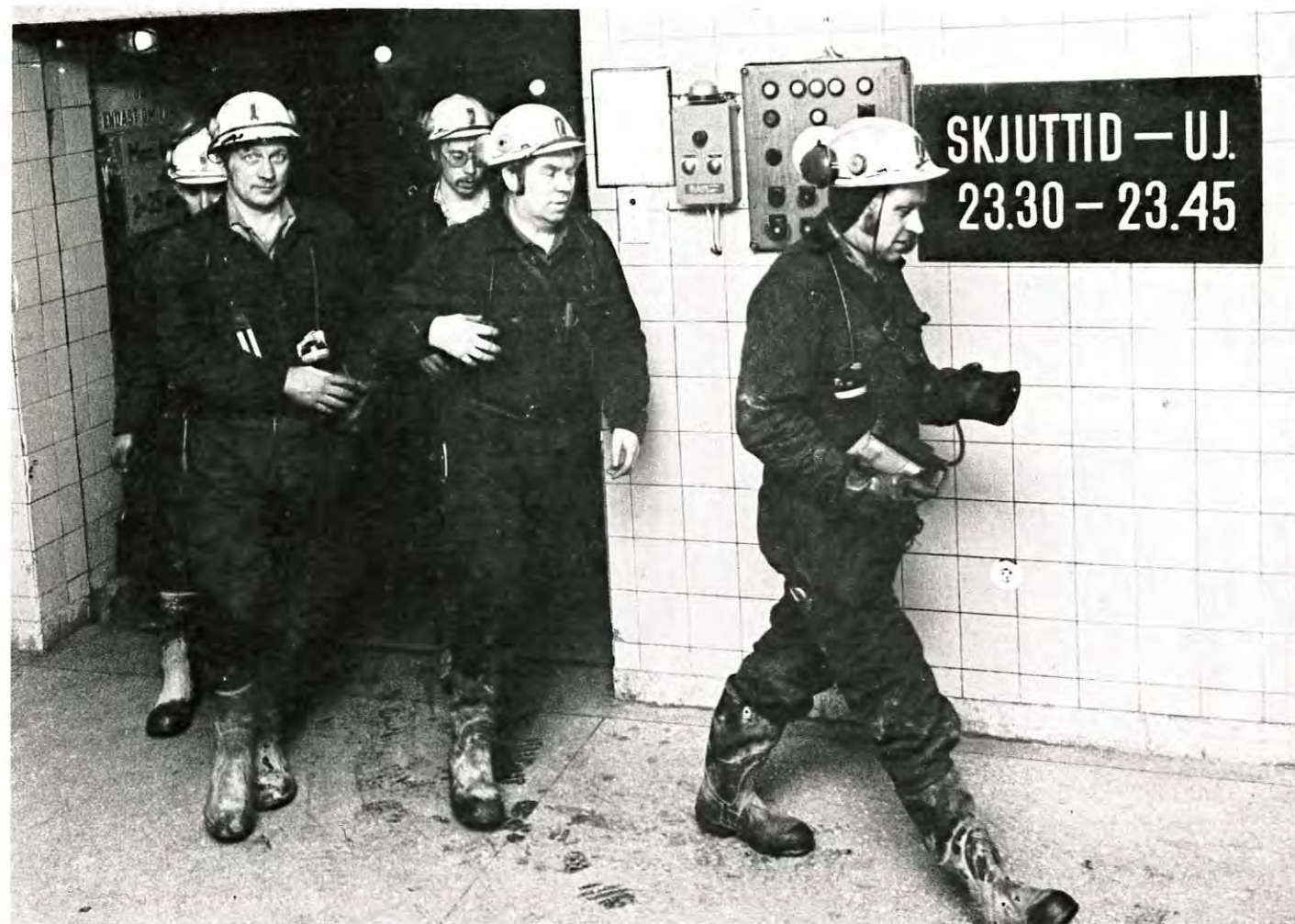
Avgörande för utvecklingen i Gällivare kommun är vad som händer i gruvindustrin, som direkt och indirekt svarar för 90 procent av industri-sysselsättningen.