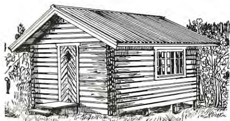
Raststuga vid Laxelet nedom Killingi.