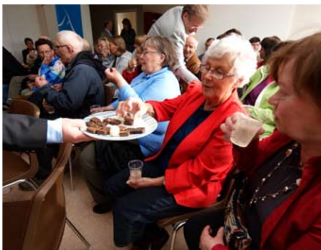
Intresserade åhörare bjöds på tillugg och underhållning.

I styrgruppen för projektet finns representanter från SSR, Svenska Samernas Riksförbund, och samebyarna i och runt Gällivare.