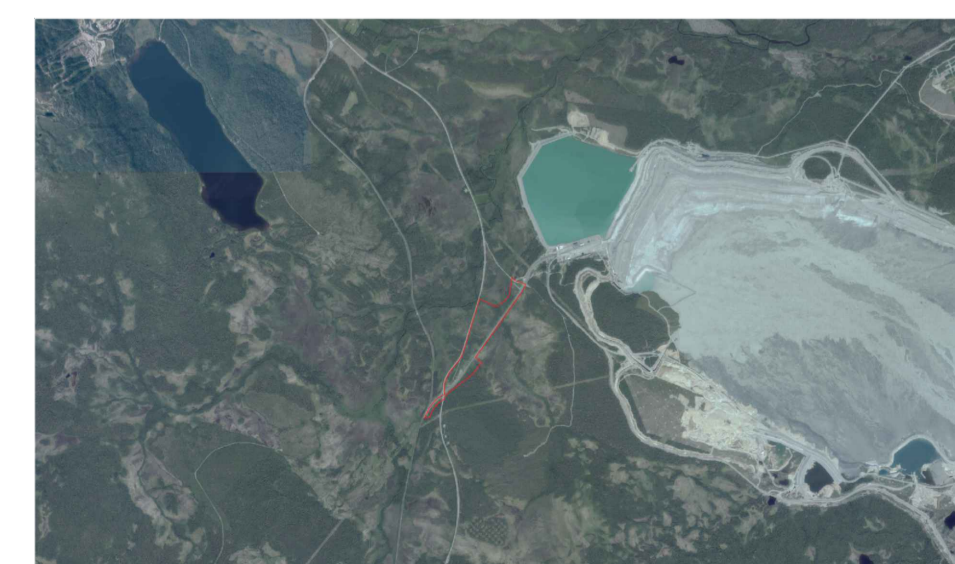
Översiktskarta (ej skalenlig).