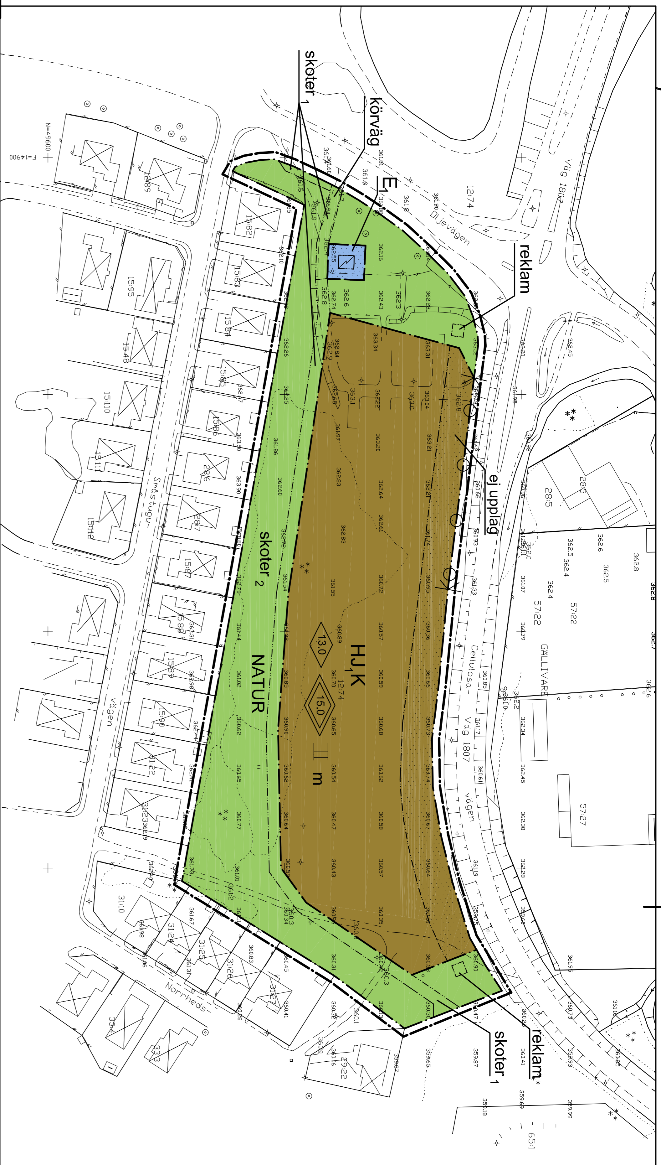
Illustrationskarta (exempel på utformning)