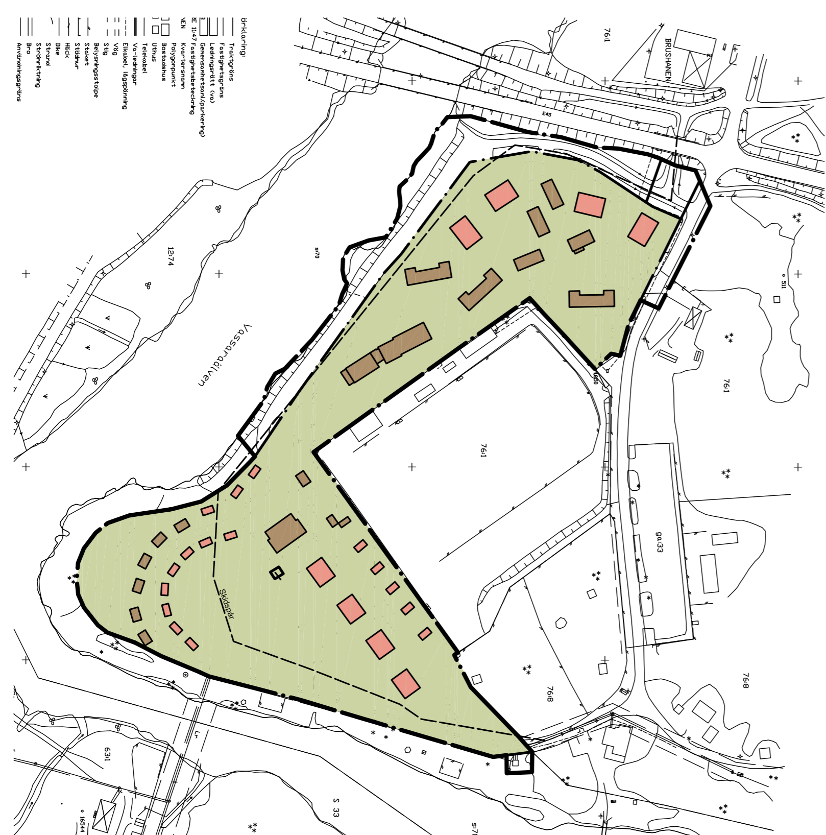
PLANILLUSTRATION Skala 1:2000 (A1)

bruna byggnader = befintliga byggnader rosa byggnader = möjlig ny bebyggelse