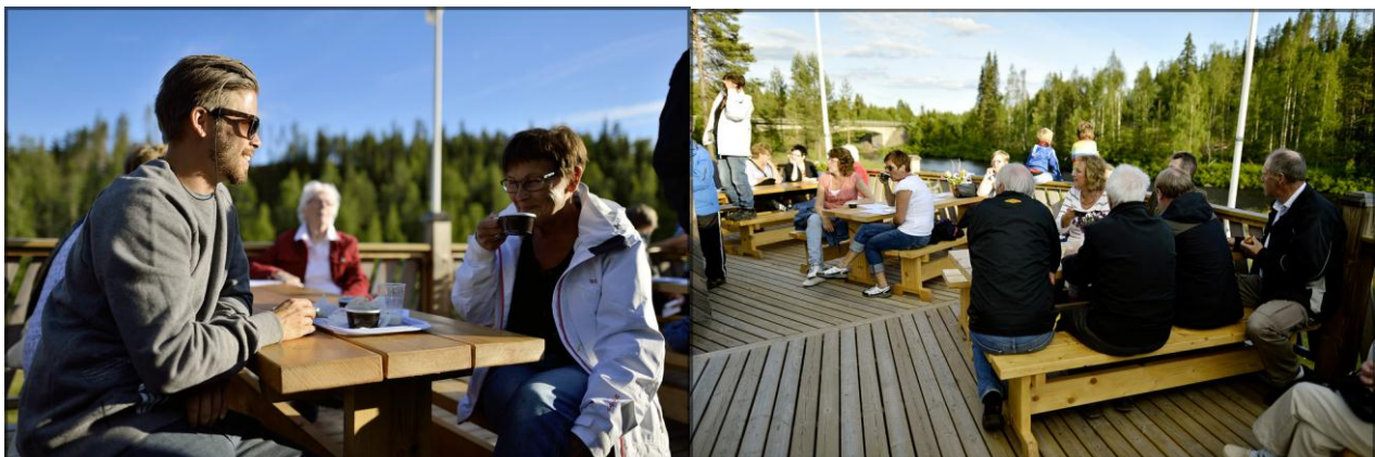
Bilder från Skrövbrons sommarcafé.

Paket alternativ – konkreta upplevelser och saker, marknadsföra bygden mer.